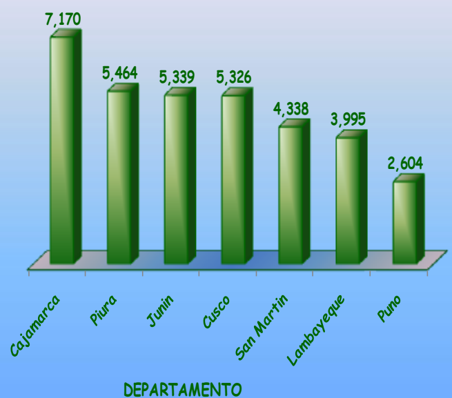
PRODUCTORES ORGÁNICOS POR DEPARTAMENTO 2010